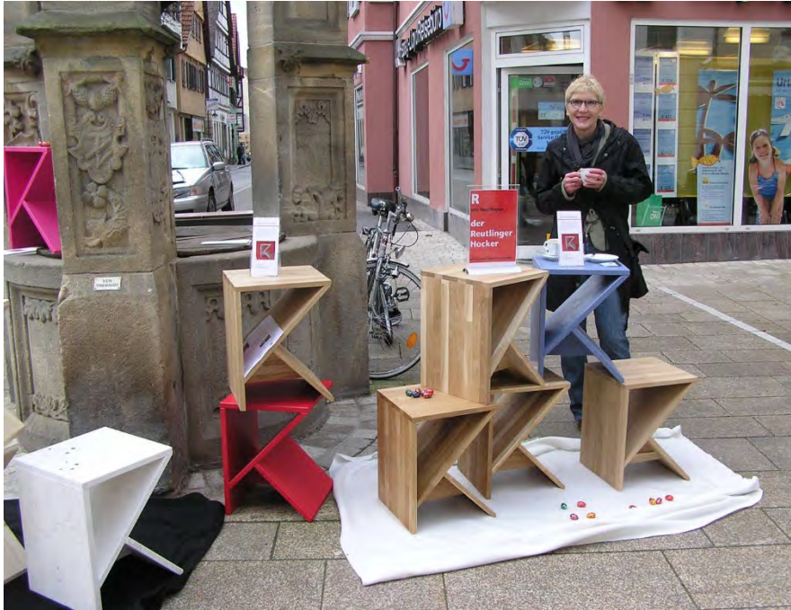
Bild: Präsentation des Reutlinger Hockers (Übungsfirma der Startnetz-Werkstatt) in der Fußgängerzone