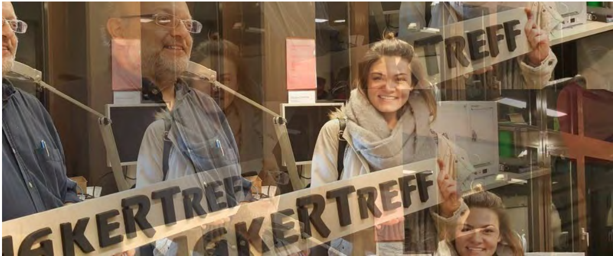
Startnetz-Werkstatt im Makertreff