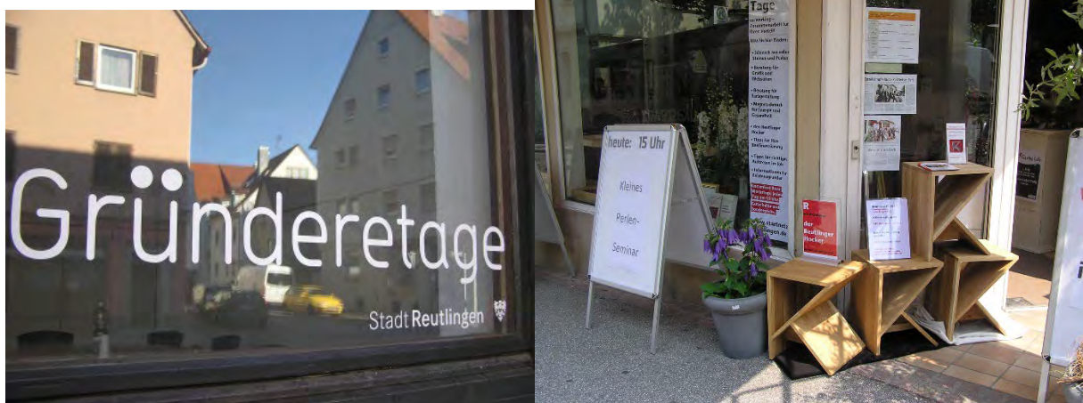
Startnetz-Werkstatt mit Arbeitsplätzen in der Tübinger Vorstadt / Pop-Up-Store für 10 Gründungen am Albtorplatz