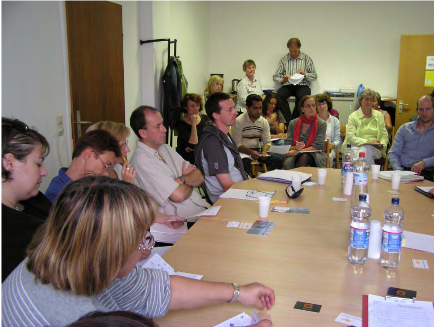
Bild: Startnetz-Werkstatt in der Tübinger Straße