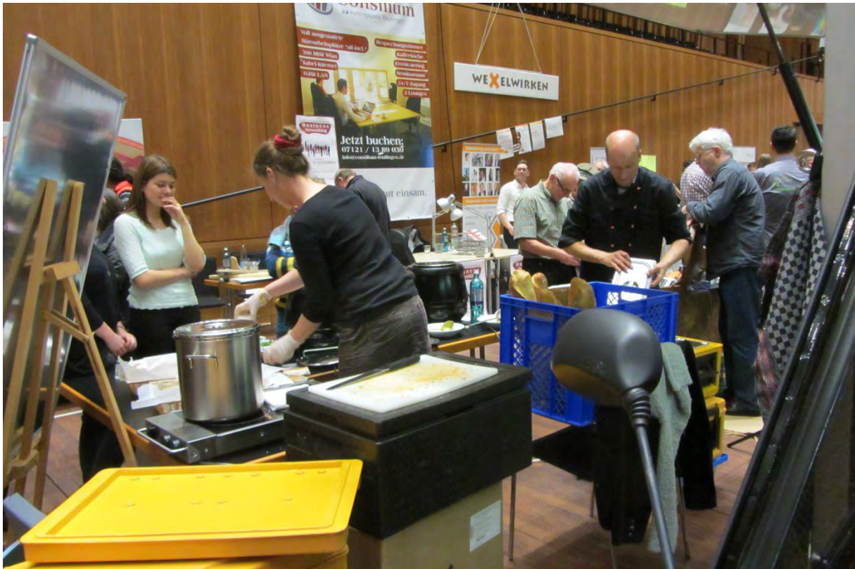
Bild: Gründermesse 2014